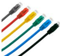
CAT. 6 U/UTP